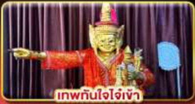
เทพทันใจใจเจ้า