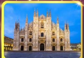
มหาวิหารแห่งเมืองมิลาน