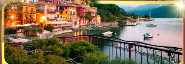
ทะเลสาบโลโบ