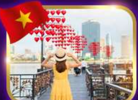
เชิควินสะพานแห่งความรัก