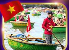
เรือกระด้ง หมู่บ้านกิมกาน