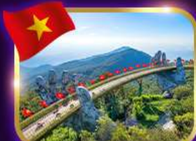
สะพานมือสีทอง บานาฮิลล์