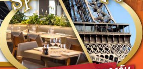
รับประทานอาหารกลางวันบนหอคอไอเฟล