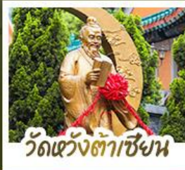
ว้ดเว้งถ้ำเซ้าเซ้ง