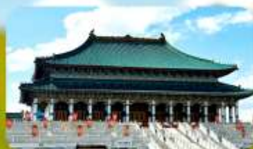
พระราชวังต้องห้ามออร์ดอส