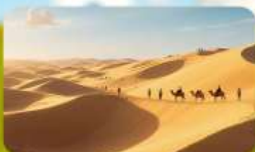
เนินทรายอินเคินทาลา