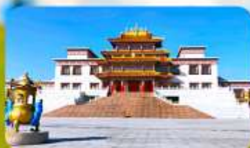
คฤหาสน์พุทธบูชาแห่งชีวิคยูลาน