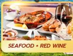
SEAFOOD + RED WINE