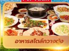
อาหารสตรีทกวางตุ้ง