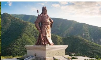
บ้านเกิดท่านกวนอู