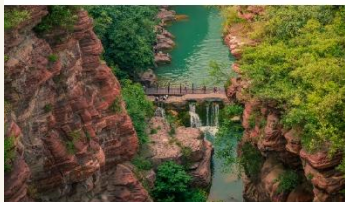
อุทยานสวรรค์หยุนโถซาน