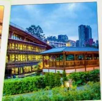
ห้องสมุดเป่ย์โถว