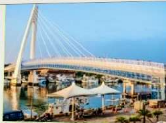
สะพานคู่รักตั้นสุ่ย