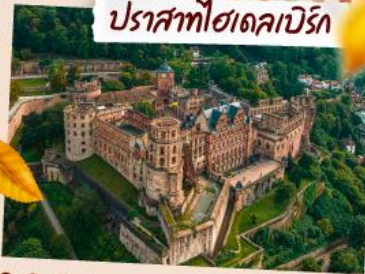
ปราสาทไฮเดคาบิรัก