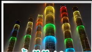
น้ำพุไม้ไผ่ตักSKP