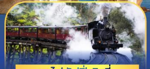
รถไฟพัพฟิงบิลลี่

ล่องเรือชมอ่าวซิดนีย์พร้อมรับประทานอาหารกลางวัน และ เข้าชมสวนสัตว์การองก้า