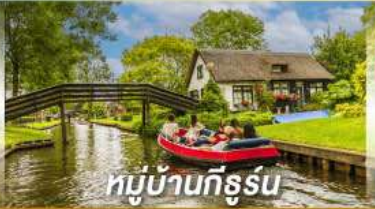
หมู่บ้านทึร์สุน