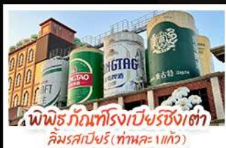
พิพิธภัณฑ์โรงเบียร์ชิงเต่า คิมรตเบียร์ (ท่าทะเล 1 แก้ว)