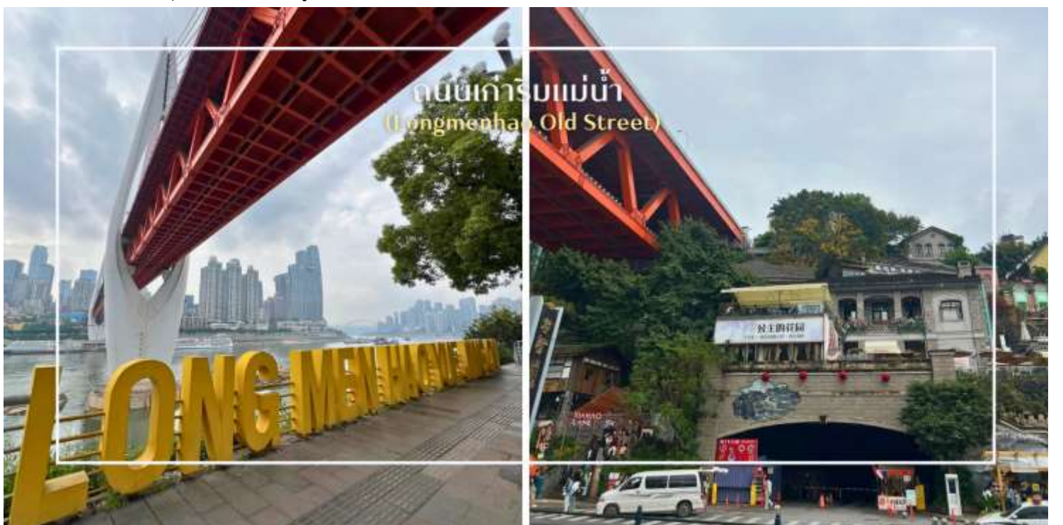
ถนนเก่าริมแม่น้ำ (Longmenhao Old Street)

นำท่านสู่ ถนนโบราณหลงเหมินฮ่าว (Longmenhao Old Street) ถนนเก่าริมแม่น้ำอีกหนึ่งแลนด์มาร์กสำคัญของเมืองฉงชิ่ง ถนนสายนี้เคยเป็นย่านการค้าและศูนย์กลางเศรษฐกิจที่รุ่งเรืองในยุคราชวงศ์หมิงและชิง ปัจจุบันได้รับการอนุรักษ์ไว้อย่างดี เพื่อเป็นแหล่งเรียนรู้ทางประวัติศาสตร์ และแหล่งท่องเที่ยวเชิงวัฒนธรรมที่เต็มไปด้วยเสน่ห์บรรยากาศของถนนยังคงอบอวลไปด้วยกลิ่นอายวันวาน อาคารบ้านเรือนแบบโบราณผสมผสานกับร้านค้า ร้านอาหาร และแกลเลอรีร่วมสมัยอย่างลงตัว อีกทั้งยังเป็นจุดชมวิวแม่น้ำที่โดดเด่น สามารถมองเห็นสะพานข้ามแม่น้ำแยงซีและทัศนียภาพของเมืองฉงชิ่งในมุมที่สวยงาม และอีกหนึ่งจุดหมายที่สะท้อนเสน่ห์ดั้งเดิมของที่นี่คือ Xiahaoli Old Street ตรอกซอกซอยแคบ ๆ บันไดหิน และสถาปัตยกรรมไม้โบราณที่ยังคงกลิ่นอายของวิถีชีวิตในอดีต แม้ในปัจจุบันจะได้รับการบูรณะและพัฒนาให้เหมาะกับการท่องเที่ยว ก็ยังคงรักษาบรรยากาศคลาสสิกเอาไว้ได้อย่างดี