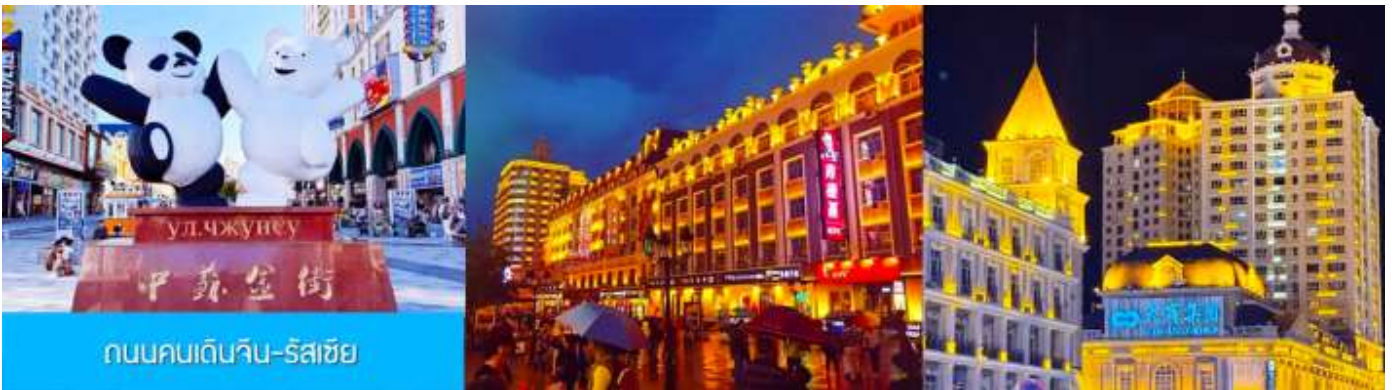
ถนนคนเดินจีน-รัสเซีย

ท่านสามารถเดินเที่ยวชม บริเวณจัตุรัสฯ เก็บภาพสวยงามของสถาปัตยกรรมสวยเก๋แบบรัสเซีย เที่ยวชมบริเวณล็อบบี้ของโรงแรมตุ๊กตารัสเซีย ที่มีการตกแต่งภายในอย่างวิจิตร รวดงามทั้งลวดลายการตกแต่งและภาพสีน้ำมัน