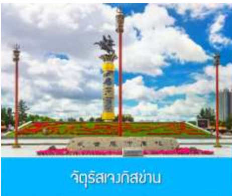
จัตุรัสวงกิสข่าน

หลังอาหารนำท่านเดินทางสู่เมือง ไห่ลาเอ๋อ 海拉尔市 (ระยะทาง 456 กม. ใช้เวลาเดินทางราว 5 ชั่วโมงครึ่ง)