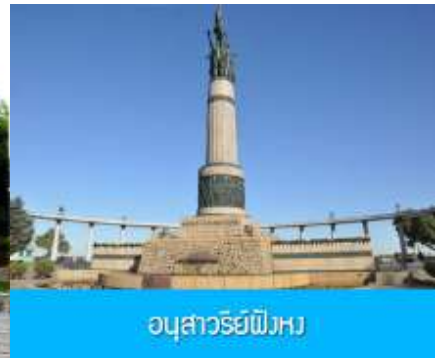
อนุสาวรีย์พิงหวง