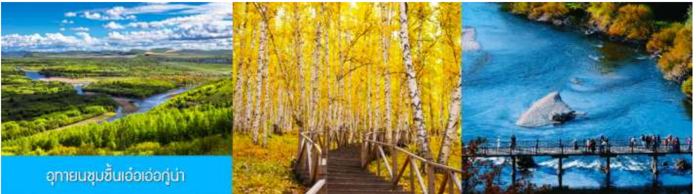
อุทยานชุ่มชื้นเอ้อเอ่อกู่หน้า

เช้า รับประทานอาหารเช้า ณ ห้องอาหารของโรงแรม (16)