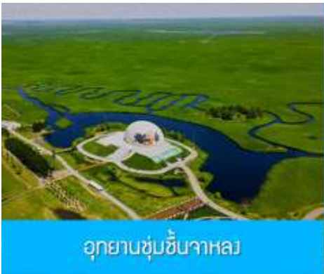
อุทยานชุ่มชื้นจาหลง

เช้า รับประทานอาหารเช้า ณ ห้องอาหารของโรงแรม (7)