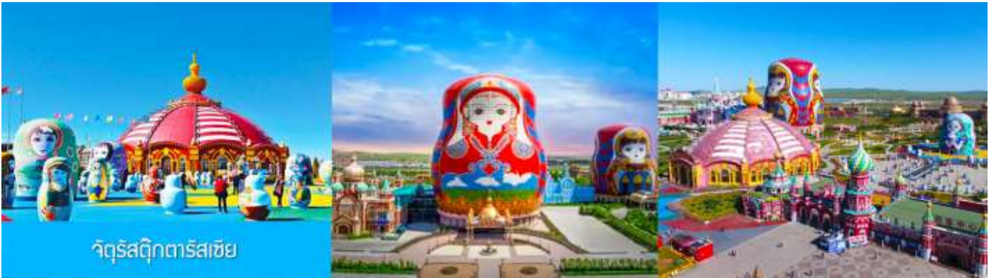
จัตุรัสตุ๊กตารัสเซีย