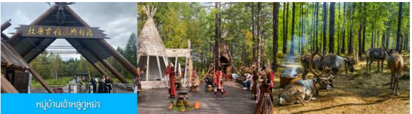
หมู่บ้านเอ้อเอ่อกู่หย่า