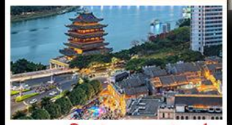
ถนนคนเดินสามตรอกสองซอย