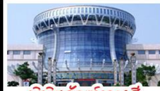
พิพิธภัณฑ์ทิวาสี

สวนสนุก FANTASYLAND - หมู่บ้านสไตล์ยุโรป พิพิธภัณฑ์ทิวาสี - ถนนคนเดินสามตรอกสองซอย ท่าเรือกิ่งจ้อ - ศาลเจ้าแม่กวนอิมพันกร เมนูพิเศษ อาหารทิวาสี, สุกีชาบูหม่าล่า