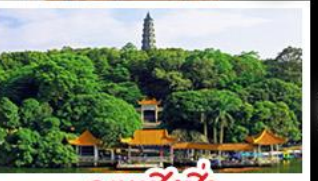
ภูเขาชิงชิว