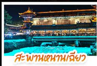
สะพานเสฉวนเฉียว