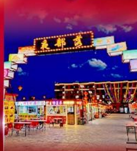
ตลาดกลางคืน ทาลาเดอซี