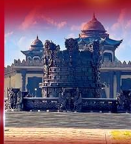
ศูนย์วัฒนธรรม มองโกเลีย หยวนหลิว