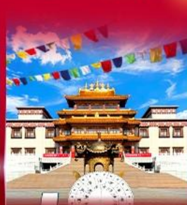
วัดพระโพธิสัตว์ ดูลาน