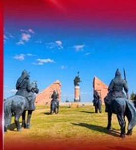
สวนสาธารณะเจงกิสข่าน