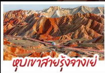
หุบเขาสายรุ้งจางเย่