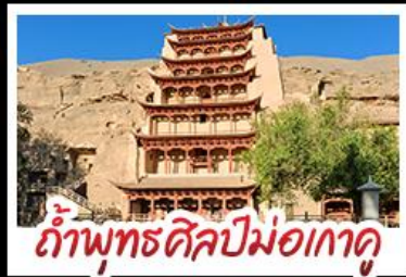
กำแพงพุทธศิลป์ม่อเกาคุ

เป็นทรายครวญ - สระน้ำวังพระจันทร์ ทะเลสาบเกลือฉาซ่า - กำพุทธรศิลป์ม่อเกาคุ หุบเขาสายรุ้งจางเย่ - ทะเลสาบซิงไห่