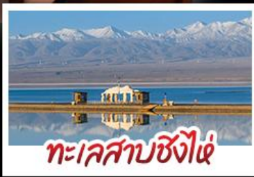
ทะเลสาบซิงไห่