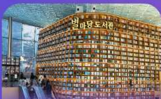
ห้องสมุดคยฮาร์ฟิลา

เดินเล่นย่านฮิป นริ๊กฮิมกาหลี ชองชุง และช้อปปิ้งซัมเมอร์ซอล สูดฟิน ย่านเมืองคงและฮงแด