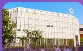
นริ๊กฮิมกาหลี