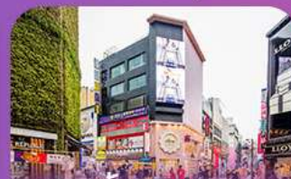
ช้อปปิ้งย่านเมียงดง