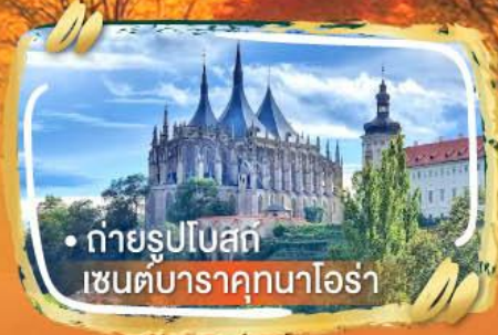
• ถ่ายรูปโบสถ์ เซนต์บาราคุกนาโอรา