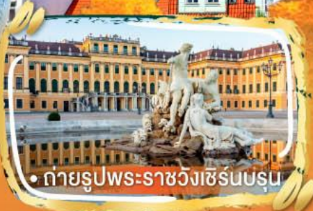
• ถ่ายรูปพระราชวังเซิร์นบรุน