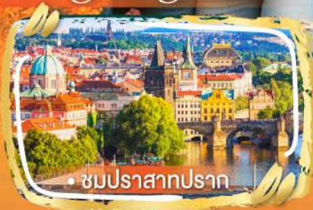
• ชมปราสาทปราก