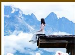
ร้านอาหารแพ่เขยูนตันอัน

ชมวิวภูเขาหิมะสวยที่สุด โรแมนติกกับแสงยามพลบค่ำ เที่ยวเมืองโบราณต้าหลี่ ลี้เจียง ป่าชา แซงกรี่ล่า ชมวิถีชีวิตของชุมชนยูนนานและทิเบต พิสูจน์ความกล้าท้าเดินชมสะพานแก้วลี่เจียง • ซุปโปงเพลินที่ถนนคนเดินหนานผิงเจียง