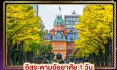
ฮิโระ-ตามฮิโรยาคิ 1 วัน

บ้างนักกระเป๋า 20 Kg. บริการอาหาร บนเครื่อง ไป-กลับ