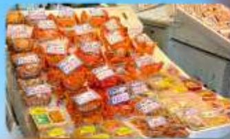
ตลาดปลาโจโก