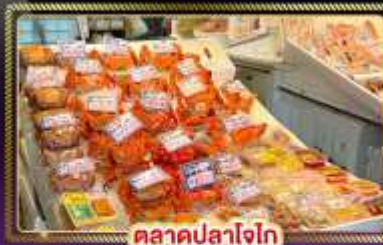
ตลาดปลาโอไก