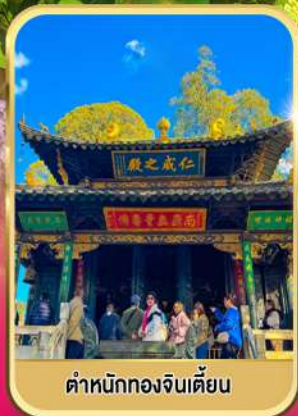
ตำหนักทองจีนเตียน