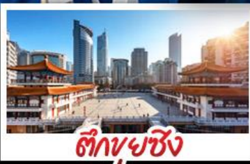
ตึกพวยซิ่ง