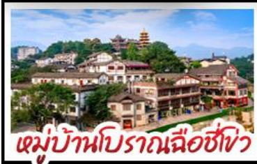
หมู่บ้านโบราณฉือซิง

พระเอกสลักหินตำจู้ - ตึกตะเกียบ Raffles City - ตึกพวยซิ่ง เกรตเตอร์เบียร์ - หมู่บ้านโบราณฉือซิง