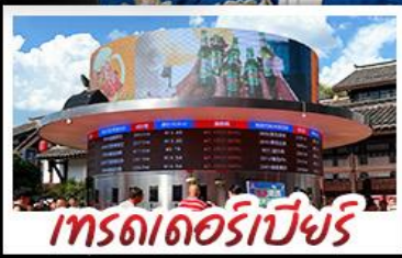
เกรตเตอร์เบียร์