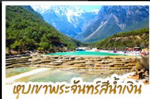
เขื่อนเขาพระจันทร์สีน้ำเงิน