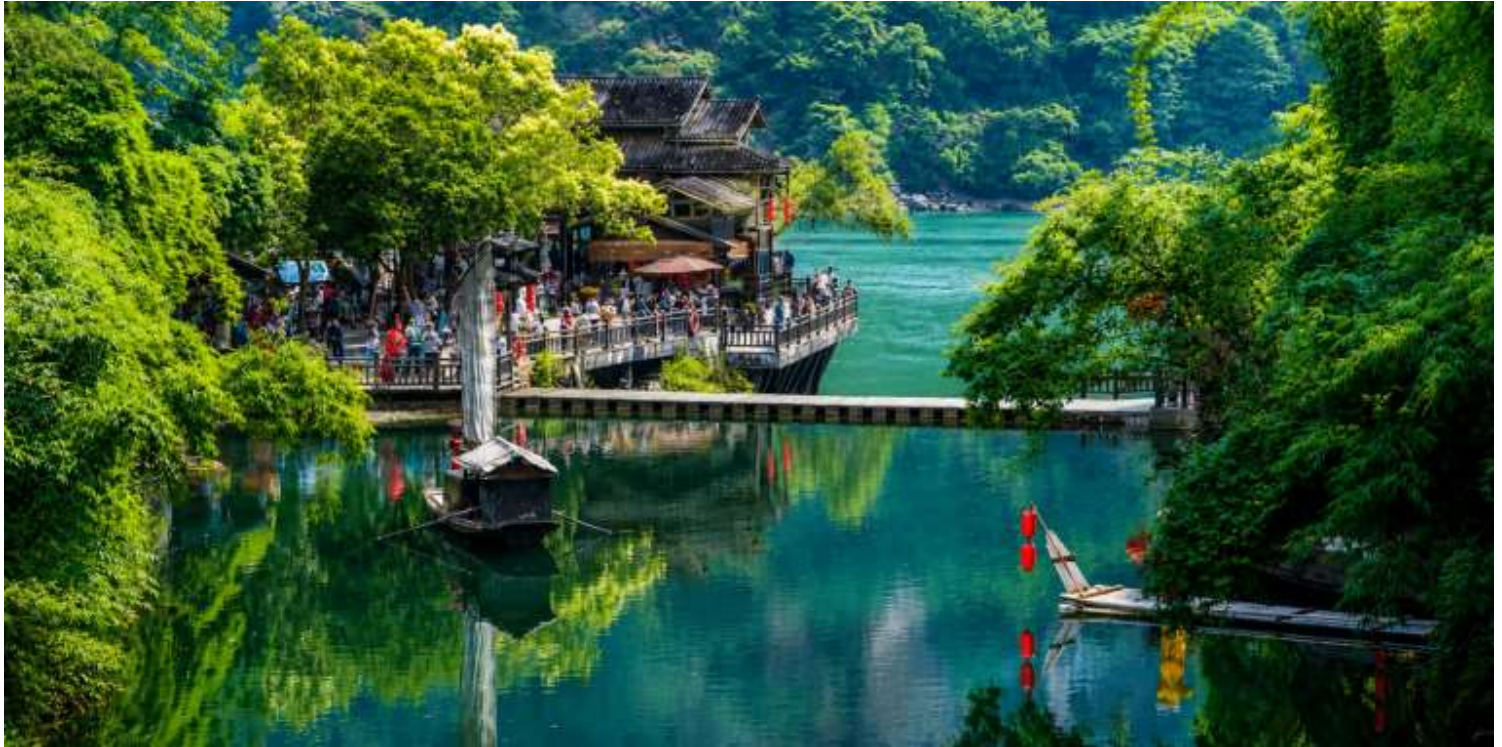
เที่ยง บริการอาหารเที่ยง ณ ภัตตาคาร (มื้อที่2)

นำท่านสู่ หมู่บ้านซานเซียเหรินเจีย (Sanxia Renjia) (รวมล่องเรือ) สถานที่นี้เป็นที่รู้จักกันในชื่อ หมู่บ้านสามผา แหล่งท่องเที่ยวระดับ 5A ตั้งอยู่ในเขตหุบเขาสามผา ริมแม่น้ำแยงซีเกียง โดดเด่นด้วยทัศนียภาพทางธรรมชาติอันงดงามของ ภูเขาหินผา สายน้ำ และหุบเขาที่โอบล้อมกันอย่างกลมกลืน สถานที่แห่งนี้สะท้อนวิถีชีวิตดั้งเดิมของชาวลุ่มแม่น้ำแยงซี เกียง ผ่านสถาปัตยกรรมพื้นบ้าน วัฒนธรรม ประเพณี ที่ยังคงเอกลักษณ์ไว้อย่างครบถ้วน พร้อมให้ท่านได้ชมการแสดง เรื่องราวเกี่ยวกับวิถีชีวิตควบคู่กับสายน้ำ