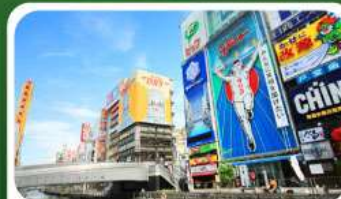
ช้อปปิ้งย่านชินไซบาชิ