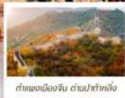
กำแพงเมืองจีน ด่านป่าต้าหลิ่ง