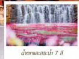
น้ำตกทะเลสาบไห่ 7 สี

โหลด 23 KG. x1 ทั้งไป - กลับ ฟรีมัชมิมทัวร์ ไม่เข้าร้านรัฐบาล ทิวทัศน์เล็ก รวมค่าเข้าชมสถานที่ตามโปรแกรม