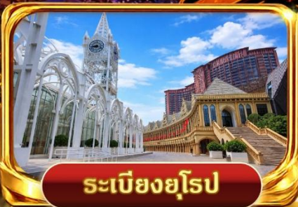
ระเบียงยุโรป