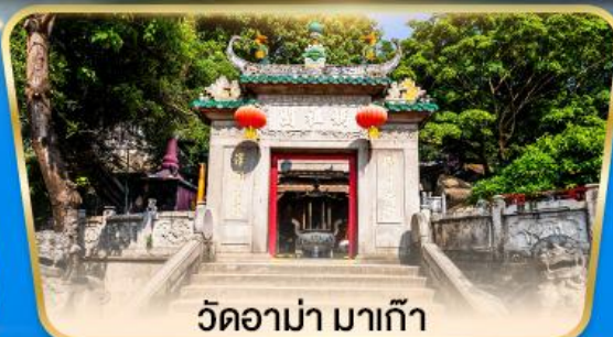
วัดอาม่า มาเก๊า