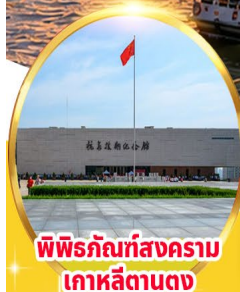
พิพิธภัณฑ์สงคราม เกาหลีตานตง