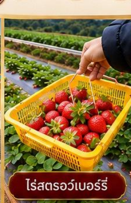
ไร่สตอร์วเบอร์รี่