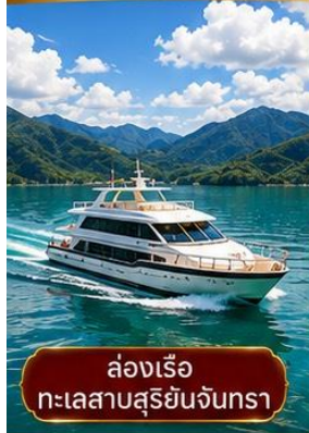
ล่องเรือ ทะเลสาบสุริยันจันทรา