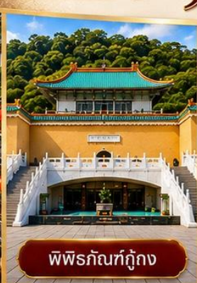
พิพิธภัณฑท์กุกง