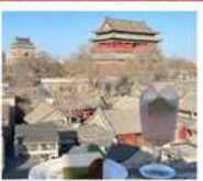
คาเฟ่ น้ำตาล