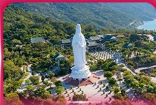
องค์กวนอิม วัดหลินอิ่ง