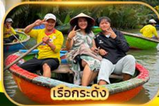
เรือกระดิ่ง