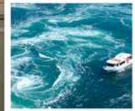
คลองเรือขมบ้านนาสุโตะ

วัดบึงไชน / ตลาดกิงงะ / โบสถ์โทกาวานี่ (จุดชมวิว) / สะพานคินโตะเคียว เกาะมียาจิมา ศาลเจ้าอิตสึคุชิมะ / สวนอนุสรณ์สันติภาพฮิโรชิมา โดโกะออนเซ็น / ถนนโอโมเตะซันโด คมปีระซัง / ปราสาทนัตสึยามา กิจกรรมทำเส้นอุด้ง / สวนริทสึริน / สถานีรับทางคุรุคุรุมารุโตะ คลองเรือขมบ้านนาสุโตะ / ซุปบึงย่านชินโซบาชิ / ตลาดปลาคุโรมง / ซุปบึงย่านอุมาเดะ