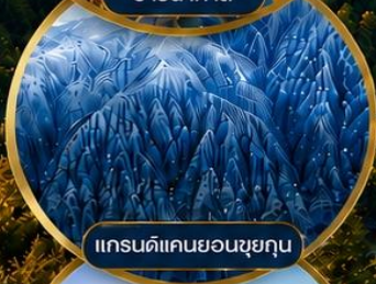
แกรนด์แคนยอนซุยคุน