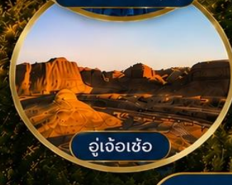
อู่เจ้อเซ่อ