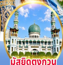
มัสยิดตงกอน