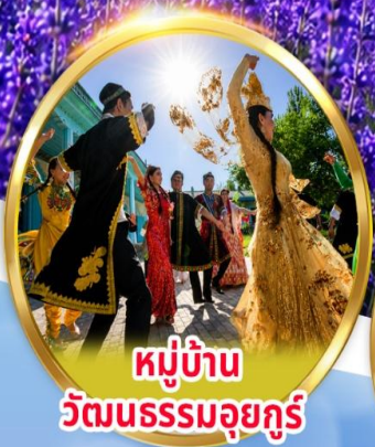
หมู่บ้าน วัฒนธรรมอูยกูร์

พิเศษ นั่งรถม้า + ซิมไอศกรีมอูยกูร์ ชมการแสดง