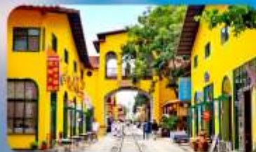
หมาหยวนมีเออร์เกจ