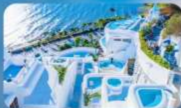
ซาโตรินี่