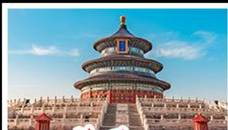
เจ้อฟ้าเทียนถาน

พระราชวังต้องห้าม - หอฟ้าเทียนถาน พิพิธภัณฑ์บิ๊อร์ซิงเต่า - ไรไวน์ - วาฬเคียวคาย