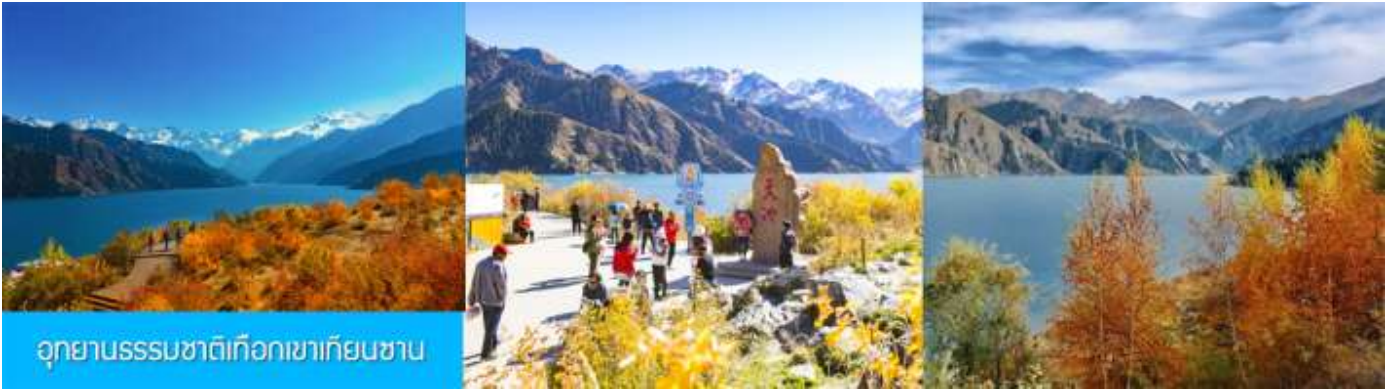
อุทยานธรรมชาติเทือกเขาเทียนชาน

เช้า รับประทานอาหารเช้า ณ ห้องอาหารของโรงแรม (7)