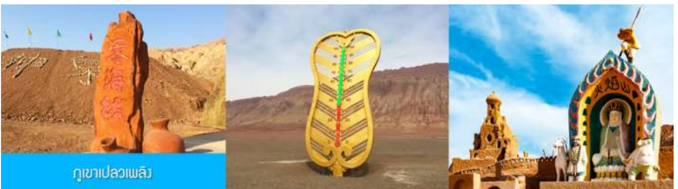
ภูเขาเปลวเพลิง

เช้า รับประทานอาหารเช้า ณ ห้องอาหารของโรงแรม (4)