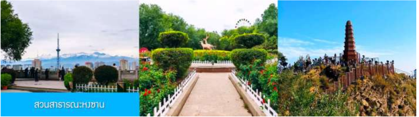
สวนสาธารณะหงซาน

โบราณนี้สร้างขึ้นในช่วงศตวรรษที่สองก่อนคริสตกาลโดยการขุดเจาะลงไปใต้พื้นดิน ภายในมีสิ่งปลูกสร้างโบราณที่มีคุณค่าทางประวัติศาสตร์ อาทิ กำแพง ป้อมปราการ ศาลาวัด และป่าเจดีย์ ฯลฯ จากนั้นนำท่านเดินทางโดยรถบัสสู่เมือง เมืองอูรูมูฉี 乌鲁木齐 (ระยะทาง 180 กม. ใช้เวลาเดินทางราว 2 ชั่วโมงครึ่ง)