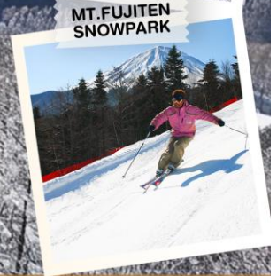
MT. FUJITEN SNOWPARK

วันเดินทาง 30 ธ.ค. - 5 ม.ค. 2570 (วันขึ้นปีใหม่)