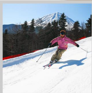
“FUJITEN SNOW PARK”