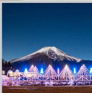
“YAMANAKAKO ILLUMINATION FANTASEUM”