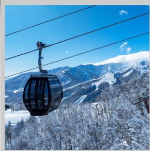
“HAKUBA IWATAKE GONDOLA”