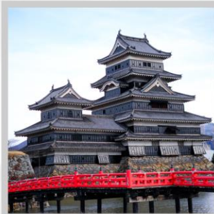
“MATSUMOTO CASTLE PARK”

สัมผัสความงดงามด้านนอก “ปราสาทมัตสึโมโตะ” ที่ตั้งตระหง่านท่ามกลางฉากหลังของเทือกเขาแอลป์ตอนเหนือ เปลี่ยนอิริยาบถ “ส่องเรือชมหุบเขาอะนะเคียว” ชมความงดงามธรรมชาติ ต้นไม้ หน้าผา และสะพานแดงอันโด่งดัง ตื่นตากับการประดับไฟกว่า 5 แสนดวง กับงาน “YAMANAKAKO ILLUMINATION FANTASEUM” ริมทะเลสาบยามานากะ สนุกสนานกับการเล่นหิมะ ในกิจกรรมต่างๆ ณ “FUJITEN SNOW PARK” พร้อมวิวภูเขาไฟฟูจิเป็นฉากหลัง ตระการตา “เทศกาลประดับไฟฤดูหนาว” ในธีมต่างๆหลากหลายโซน จัดแสดงไฟกว่า 2 ล้านดวงที่ยิ่งใหญ่ติดอันดับ1 ของญี่ปุ่น เปลี่ยนอิริยาบถ “นั่งกระเช้าฮาคุบะ อิวะตะกะะ” เพื่อชมวิวเทือกเขาแอลป์ญี่ปุ่นกับทิวทัศน์ฤดูหนาวแบบพาโนรามา