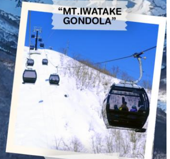
"MT. IWATAKE GONDOLA"