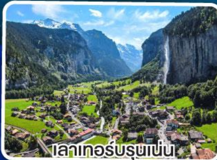
เลาเทอร์บูรชานัน