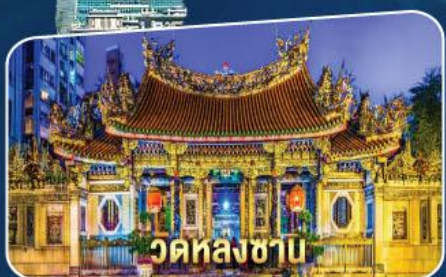
วัดหลงซาบ