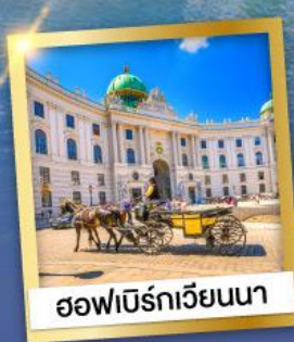
ฮอฟเบิร์กเวียนนา