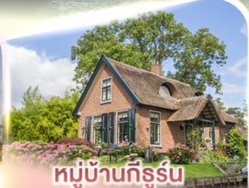
หมู่บ้านกีธูร์น